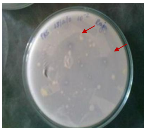
شکل ۱- تشکیل هاله (با فلش قرمز در تصویر مشخص شده است) در محیط کشت پیکوواسکای

کلیه تجزیه و تحلیل داده‌ها با استفاده از نرم‌افزار ۱۹ SPSS انجام گرفت. ابتدا توزیع نرمال داده‌ها با آزمون کولموگروف-اسمیرنوف بررسی شد. سپس از آنالیز واریانس یکطرفه و مقایسه میانگین دانکن با حدود اطمینان ۹۵ درصد بین تیمارهای مختلف باکتری (چهار سطح شاهد (عدم تلقیح)، باکتری میکروباکتریوم