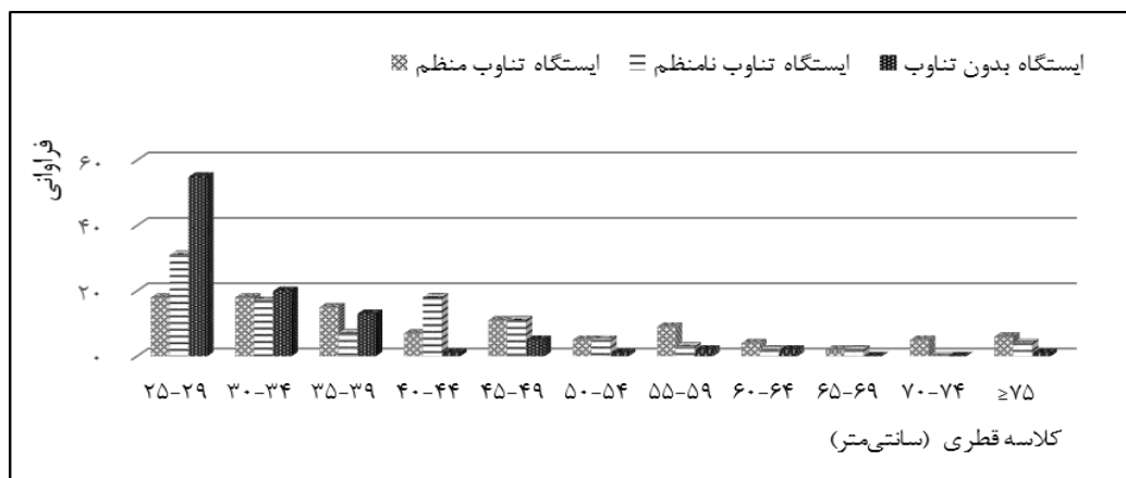
شکل ۲- نمودار پراکنش قطری درختان در تناوب‌های مختلف

پراکنش قطری در تناوب‌های مختلف در شکل ۲ فراوانی درختان در طبقه‌های قطری