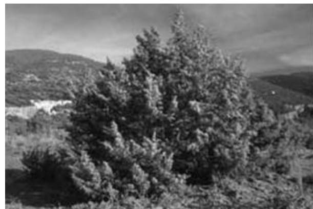
شکل ۱- نمایی از فرم ایستادهٔ Juniperus oblonga

سردهٔ ارس ( Juniperus ) از معدود سوزنی‌برگان ایران به‌شمار می‌آید که بعد از بنه بیشترین پراکنش را در میان درختان بومی ایران دارد. این درختان ارزش اقتصادی و حفاظتی بسیار دارند و در سخت‌ترین شرایط به‌ویژه از نظر بستر خاک مستقر شده‌اند (کروری و خوشنویس، ۱۳۷۹). به‌طور کلی ارس‌های ایران به دو گروه ارس‌های ایستاده و خزنده تقسیم می‌شوند. ارس‌های خزندهٔ ایران، J. sabina و J. communis و ارس‌های ایستادهٔ ایران، J. excelsa ، J. foetidissima و J. polycarpus هستند (ثابتی، ۱۳۵۵). یکی دیگر از گونه‌های ارس در ایران گونهٔ J. oblonga است که به هر دو صورت ایستاده و خزنده مشاهده می‌شود. این گونه درختچه‌ای است به ارتفاع ۱ تا ۴ متر و دوپایه با برگ‌هایی فراهم سه‌تایی، درفشی سوزنی، نوک باریک، به طول ۱۴ تا ۲۰ میلی‌متر و به‌ندرت کمتر تا ۱۲ میلی‌متر و پهنای ۱/۵ تا ۲ میلی‌متر؛ سطح رویی برگ‌ها نوار سفید رنگی دارد که اغلب تا نیمه یا تا نوک با رگه‌ای به دو قسمت تقسیم می‌شود. در روی شاخه‌های انتهایی در زیر محل اتصال برگ‌ها کیسه‌های صمغی وجود دارد. میوه تقریباً کروی به قطر ۳ تا ۱۰ میلی‌متر، به رنگ قهوه‌ای مایل به سیاه یا سیاه براق، گاهی کمی گرد و حاوی سه دانه است. رسیدن میوه در سال دوم یا سوم اتفاق می‌افتد. این گیاه متعلق به بخش کوهستانی ایران تورانی است (اسدی، ۱۳۷۶) (شکل ۱). محققان این گونه را بعد از کلیبر در منطقهٔ باغلاز و در ارسباران در عاشقلو، ارمنی‌اولن و در خلخال در درهٔ اندبیل مشاهده کرده‌اند.