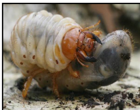
شکل ۱- لارو و حشره کامل کرم سفید ریشه درختان ( Melolontha kraatzii persica R.)