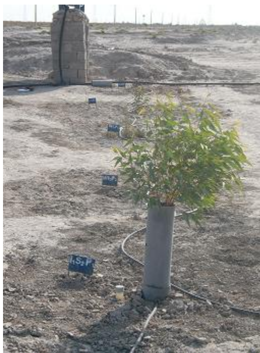
شکل ۲- نمونه‌ای از نهال‌های مستقر در لوله پلاستیکی

بیشترین قلیابیت (۸/۴) را داشته است. بنابراین مقدار قلیابیت از سطح خاک تا عمق یک متری روند افزایشی داشته و در اعماق پایین‌تر با کاهش همراه بوده است. بیشترین مقدار شوری (۲۳/۷ میلی‌زیمنس بر سانتی‌متر) در عمق ۱۰۰-۷۵ سانتی‌متر و کمترین