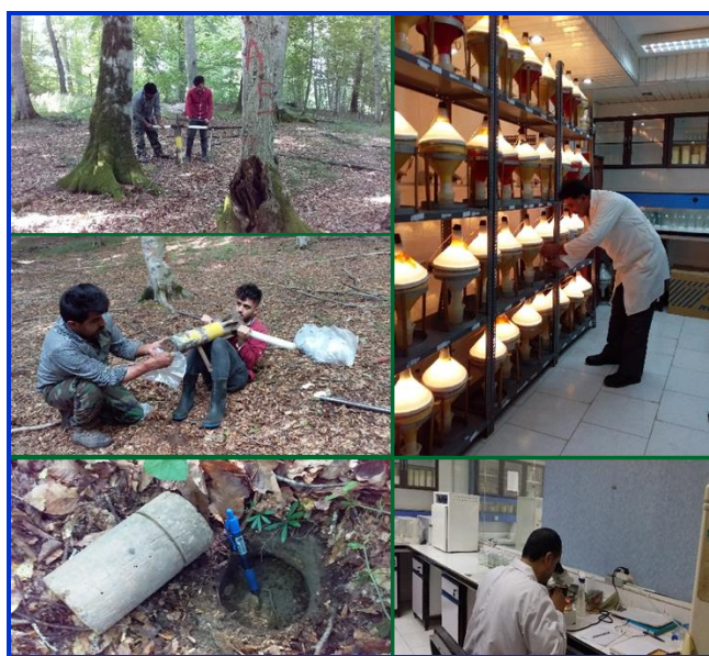
شکل ۲- نمونه‌برداری و جداسازی گروه‌های مختلف بی‌مهرگان خاکزی از جنگل‌های هفت‌خال

شیوه اجرای پژوهش عملیات صحرایی این تحقیق در تابستان ۱۳۹۸ و از اواسط تیر تا اواسط مرداد انجام گرفت. در این تحقیق ۵۰ نمونه خاک به‌صورت منظم تصادفی در شبکه‌ای به ابعاد ۱۵۰ متر در ۲۰۰ متر برداشت شد.