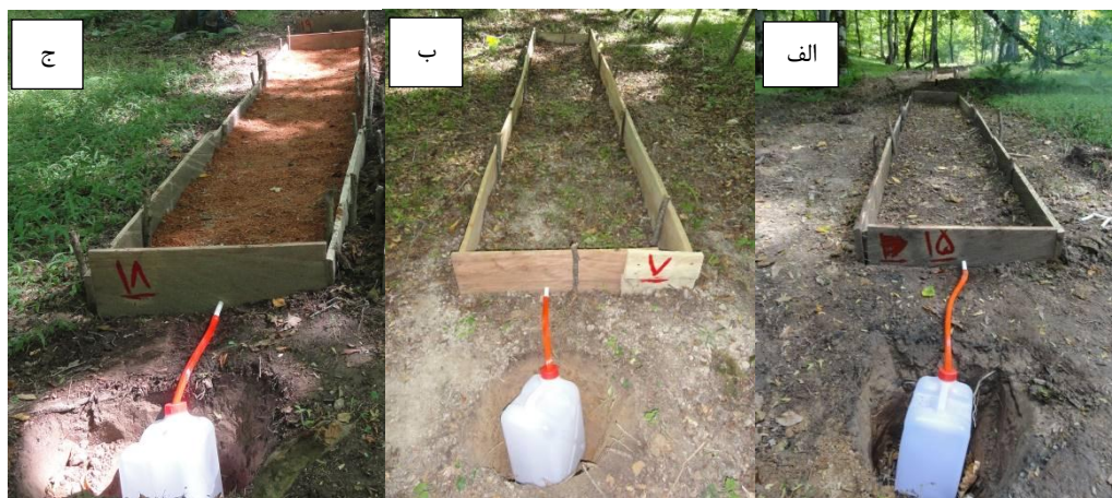
شکل ۱- نمونه تیمارهای پلات‌های (الف) مسیر چوبکشی بدون تیمار؛ (ب) شاهد جنگل؛ (ج) مسیر با تیمار مالچ خاکاره.